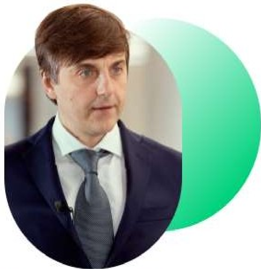
Кравцов Сергей Сергеевич,

Министр просвещения Российской Федерации